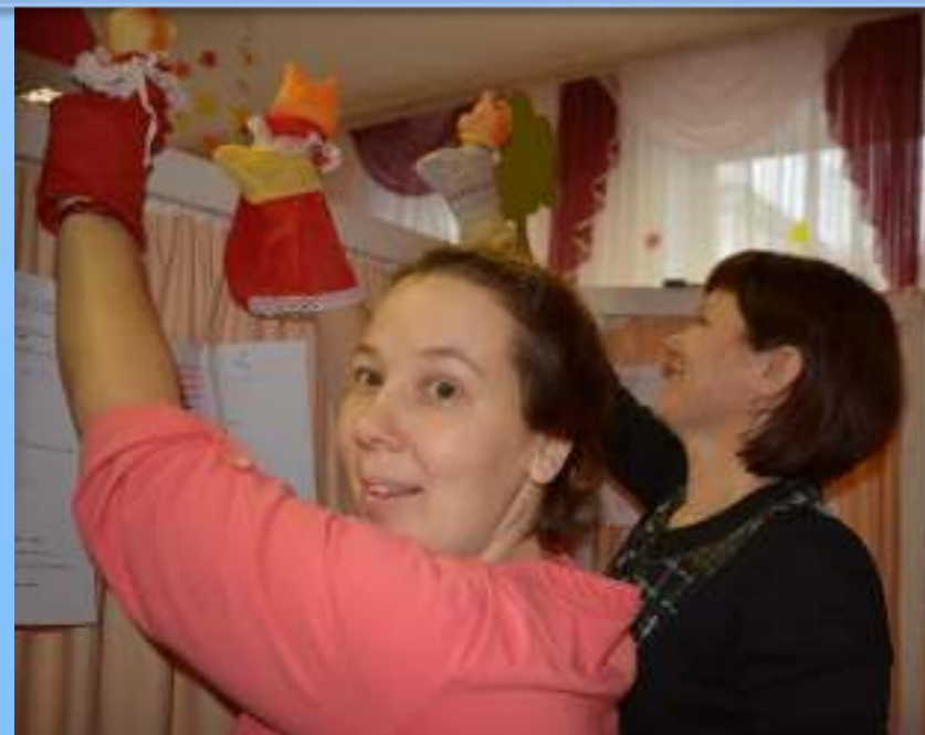
Сказка «Кот, петух и лиса»