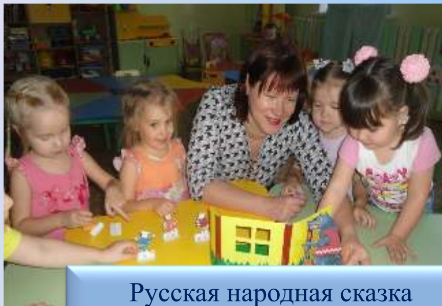
Русская народная сказка «Волк и семеро козлят»