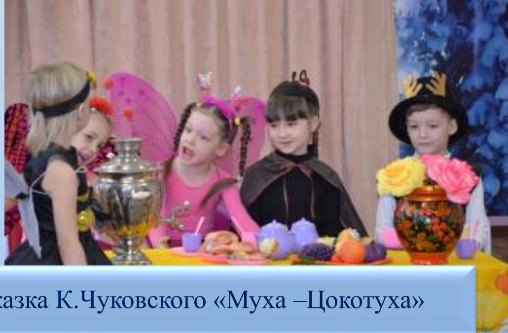
Сказка К. Чуковского «Муха – Цокотуха»