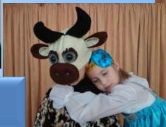
Русская народная сказка «Хаврошечка»