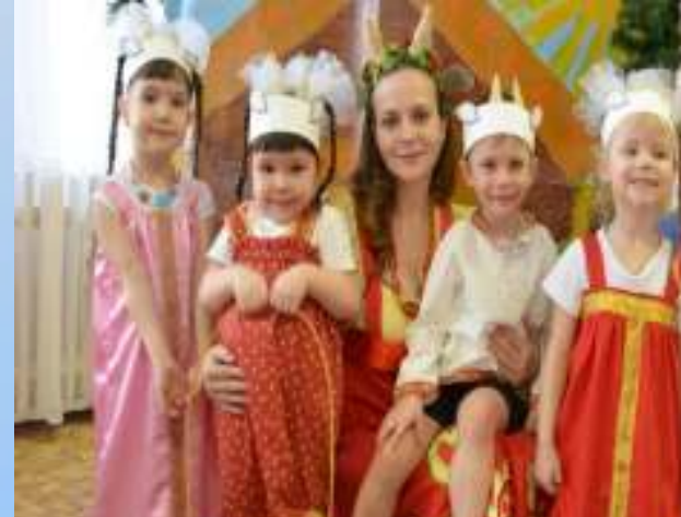
Сказка «Волк и семеро козлят»